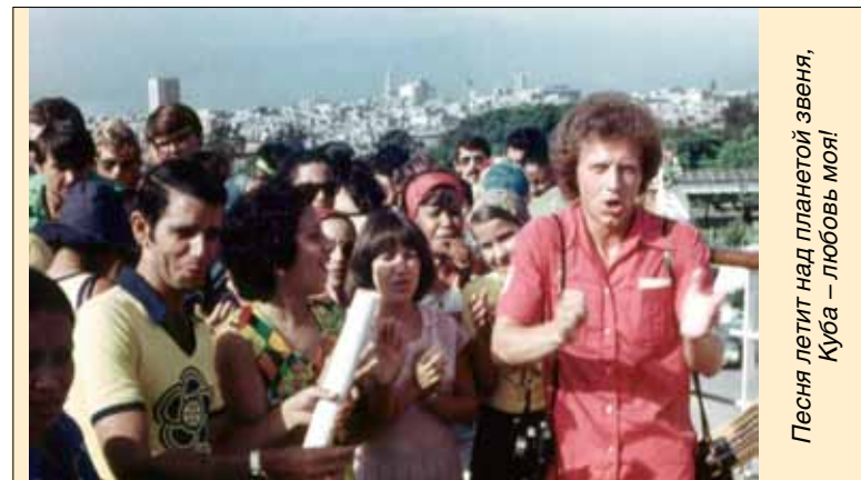
Песня летит над планетой звеня, Куба – любовь моя!

...И вот наконец остров Свободы. Фестиваль продолжался неделю, и все эти дни страна не работала. К нам на корабль приходил Рауль Кастро, а вот Фиделя не видели. В подарок кубинцам мы привезли несколько новеньких Икарусов с