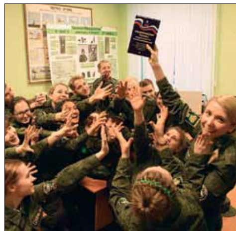
Воинский устав – наша путеводная звезда!

После перерыва мы шустро вернулись на места. Нас проинструктировали, разделив на взводы и отделения. Затем поступил приказ проследовать на построение.