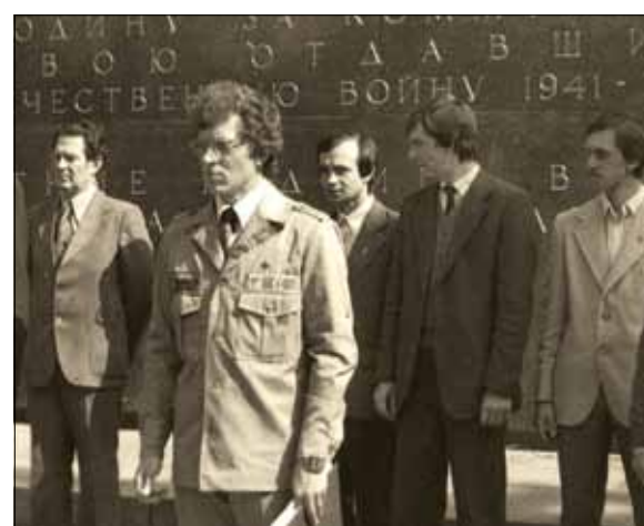
1982 г. Митинг у Памятника погибшим политехникам перед отъездом зонального ССО вузов города на Саяно-Шушенскую ГЭС